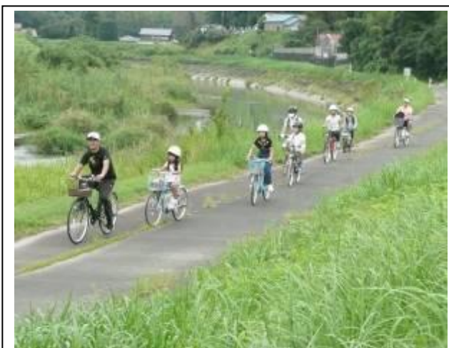
菊川を横に サイクリング気持ちいい～！！