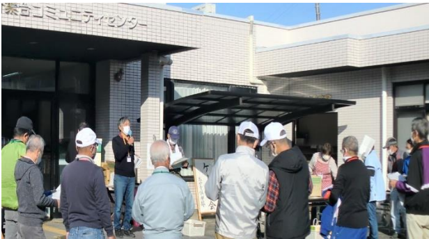
▲ 開催前のスタッフのミーティングの様子。