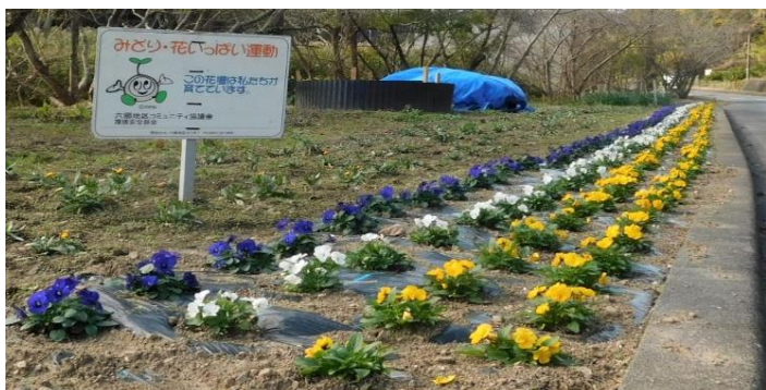
▲ 極楽寺通りの花壇の様子。

環境美化部会の皆さんは、10 月 19 日と 20 日午前中、六小通りと極楽寺通りの花壇の植え替えを行いました。植え作業は草取り、整地、定植と大変な手間のかかる作業ですが、皆さん楽しみながら参加しています。特に「みどり・花いっぱい運動」での皆さんの力は、頼りになる協力者です。作業していただいた皆様、お疲れさまでした。