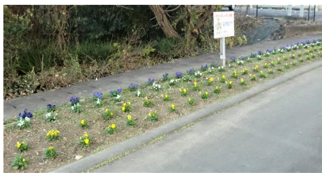
▲ 六小通りの花壇の様子