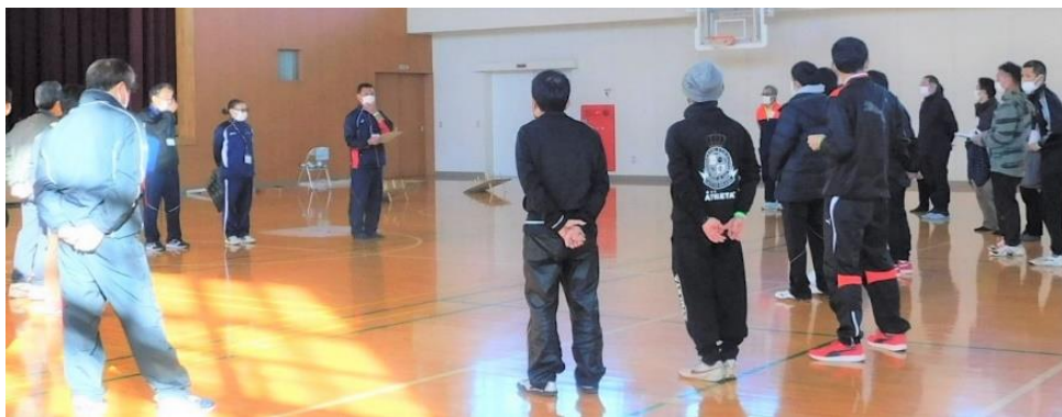
▲ 開催前のスタッフのミーティングの様子

当日は六郷地区のスポーツ推進員・スポーツ指導委員・スポーツ委員の約 30 名のスタッフの皆さんが指導・お手伝いする中で、9 種類の軽スポーツを 72 名の子ども達が楽しみました。