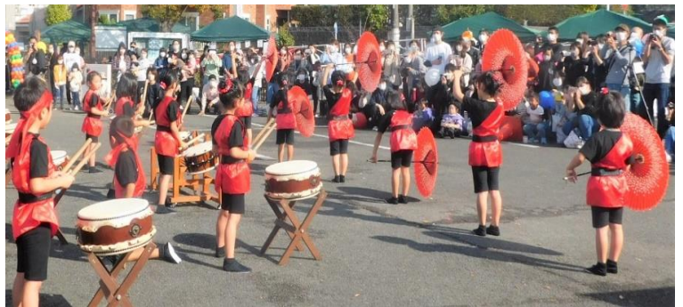
▲ 双葉っ子太鼓は元気いっぱいでした。