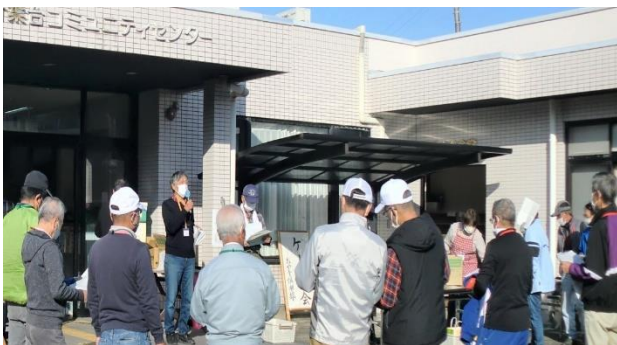
▲ 開催前のスタッフのミーティングの様子。