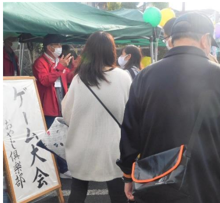
▲ 青少年健全育成部会の楽しいゲーム大会。