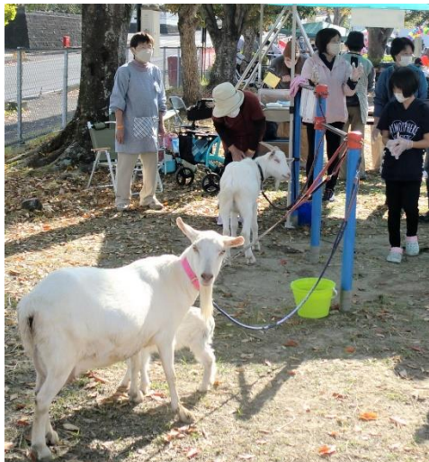
▲ 「ここくる」さんのヤギさんも来ました。